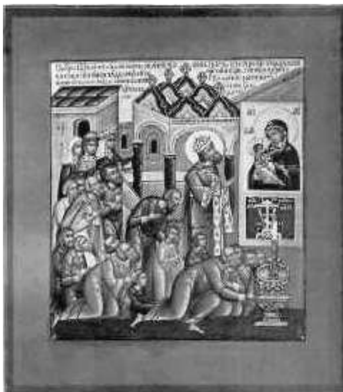
12. Антонио Поссевино