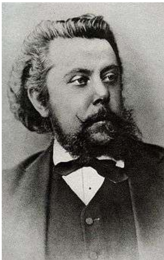
6. Портрет П.А. Столыпина