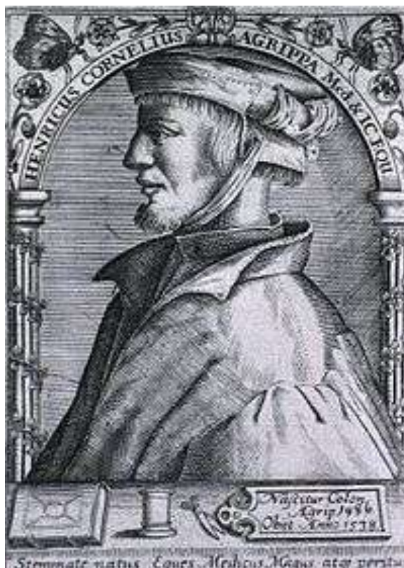
10. И. Репин «Иван Грозный убивает своего сына»