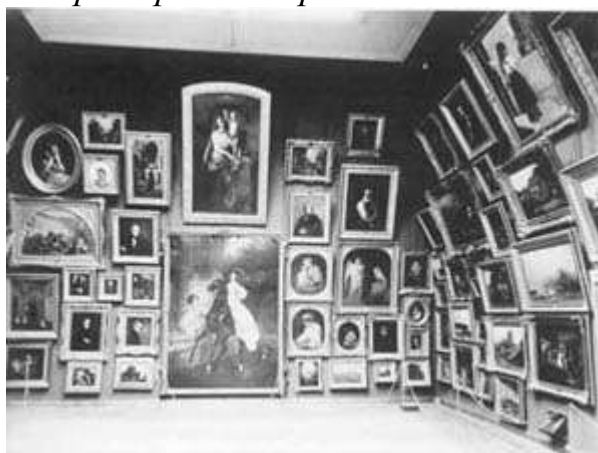
Галерея при П.М.Третьякове в 1898 г.

Художники и историки искусства давно уже заметили, что, "не появившись в свое время П.М.Третьяков, не отдайся он всецело большой идее, не начни собирать воедино Русское Искусство, судьбы его были бы иные: быть может, мы не знали бы ни "Боярыни Морозовой", ни "Крестного хода...". Ни всех тех больших и малых картин, кои сейчас украшают знаменитую Государственную Третьяковскую галерею (М.Нестеров).