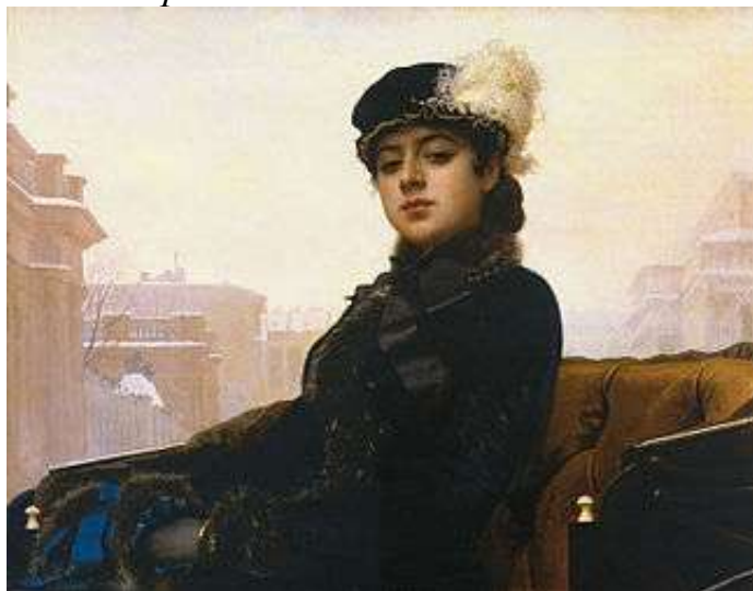
И.Н.Крамского «Незнакомка» 1894г.

Может, все дело в том, что портрет с самого начала должен был занять подобающее ему место?