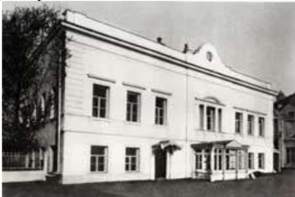
Дом Третьяковых в Толмачах. 1890-е гг.

Но "...моя идея, - скажет он в конце пути, - была с самых юных лет наживать для того, чтобы нажитое от общества вернулось бы также обществу (народу) в каких-либо полезных учреждениях; мысль эта не покидала меня во всю мою жизнь..." Как видим, идея общественного служения, типичная для его эпохи, по-своему им понятая и истолкованная, вдохновляла его.