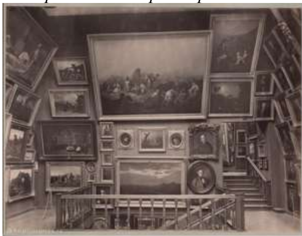
Галерея Павла Сергея Третьяковых.

По решению Московской городской думы, юридически теперь владевшей галереей, П.М.Третьяков был назначен ее пожизненным попечителем. Как и прежде, Третьяков пользовался почти единоличным правом отбора произведений, осуществляя покупки как на капитал, выделяемый думой, так и на свои собственные средства, передавая такие приобретения уже в качестве дара в "Московскую городскую художественную галерею Павла и Сергея Михайловичей Третьяковых". После смерти П.М.Третьякова делами галереи стал ведать Совет попечителей, избираемый думой.