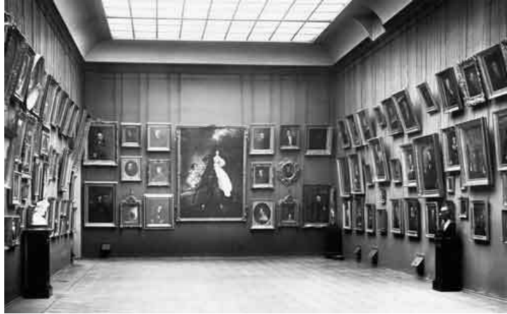
Брюлловский зал. Фотография 1910-х годов.

За последние полвека Третьяковская галерея превратилась не только в огромный музей с мировой известностью, но и в крупный научный центр, занимающийся хранением и реставрацией, изучением и пропагандой музейных ценностей.